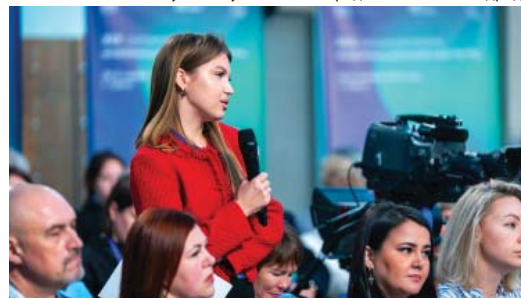
Подняли на пресс-конференции и чувствительную для всего округа проблему долгостроев

рук, добавив, что осенью этого года с территории Югры выдворены более 1 000 человек. – Еще плюс 5 видов экономической деятельности, которые уже сегодня проработаны, с 1 января 2026 года будут добавлены к тем, где запрещен труд иностранцев. Это курьерская служба, виды деятельности, связанные с традиционными промыслами: сбор дикоросов, рыболовство, оленеводство. Мы увеличили на 30% стоимость авансового платежа за выдачу патента на иностранцев, – заявил губернатор Югры. Ведется жесткий контроль и постоянный мониторинг ситуации региональной властью совместно с правоохранительными органами. Никаких «обманутых дольщиков» Подняли на пресс-конференции и чувствительную для всего округа проблему долгостроев, с которыми региональная власть планомерно работает. Руслан Ку-