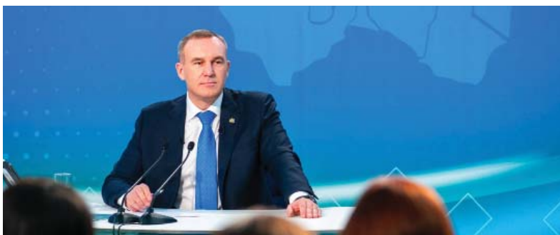
Каждую тему, поднятую журналистами, губернатор раскрывал максимально подробно

ГУБЕРНАТОР ЮГРЫ РУСЛАН КУХАРУК ПРОВЕЛ СВОЮ ПЕРВУЮ ПРЕСС-КОНФЕРЕНЦИЮ, ОТВЕТИВ В ТЕЧЕНИЕ 4 ЧАСОВ НА БОЛЕЕ ЧЕМ 40 ВОПРОСОВ ЖУРНАЛИСТОВ. ПРЕСС-КОНФЕРЕНЦИЯ СОСТОЯЛАСЬ НА ПОЛЯХ ФОРУМА «ИНФОРМАЦИОННЫЙ МИР ЮГРЫ» В СУРГУТЕ. НА РАЗГОВОР С ГУБЕРНАТОРОМ АККРЕДИТОВАЛИСЬ 130 ПРЕДСТАВИТЕЛЕЙ ФЕДЕРАЛЬНЫХ И РЕГИОНАЛЬНЫХ СМИ, БЛОГОСФЕРЫ И ПРЕСС-СЛУЖБ РАЗЛИЧНЫХ ОРГАНИЗАЦИЙ