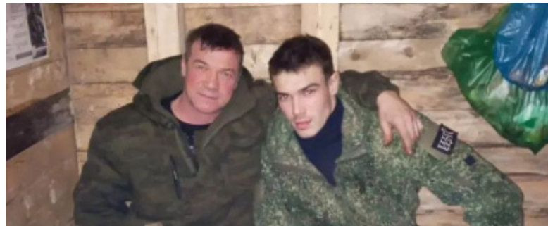
Отец и сын вместе служат в зоне СВО