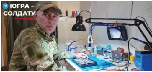
«Греф»: «Вот из таких маленьких осколочков и огромной мотивации и куется наша победа»

На гражданке боец был сотрудником судебно-медицинской экспертизы. На передовой он тоже выполняет очень тонкую работу, но теперь с пинцетом и паяльником: под микроскопом восстанавливает цифровую технику, за-