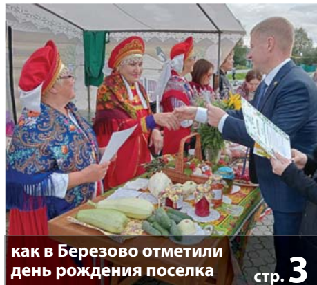
как в Березово отметили день рождения поселка