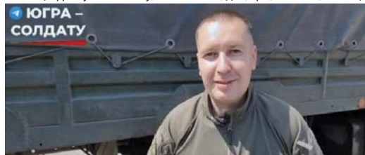
«Ястреб»: «Главное, что меня ждут дома: жена, две дочки и сын»

– Я почти год собирался, родным все уши прожужжал про то, что хочу попасть сюда. Они понимают мой выбор, спасибо за это родителям, которые поддержали меня. Спасибо старшим товарищам, которые объясняли все, когда