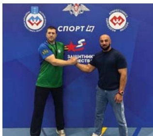
Победа Дегтярева – прежде всего преодоление самого себя

В целом фонд обеспечивает полноценное сопровождение ветеранов специальной военной операции, а также членов семей погибших бойцов, ока-