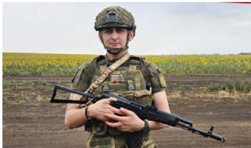
За плечами Виталия – бои за Водяное, Опытное, Авдеевку и Ласточкино, где получил тяжелое ранение

В зоне специальной военной операции сегодня защищают Россию и возвращают исконные наши территории самые мотивированные, подготовленные, понимающие, за что они сражаются, бойцы. У каждого из них есть своя, личная история решения с оружием в руках принести пользу Отечеству. И каждый из говорит, что даже самое хорошее вознаграждение за их боевую работу – это лишь вторичный фактор в стремлении подписать контракт с Минобороны РФ. Главное – то, что в детстве они читали нужные книги, а родители дали им нужное воспитание. Патриотизм и любовь к Родине – вот что ведет этих мужчин на фронт