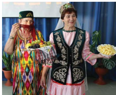
Коренные народы: история, культура, творчество

ТВ ПРОГРАММА НА НЕДЕЛЮ 18.08 - 24.08 СТР. > 7-8 | 9-10