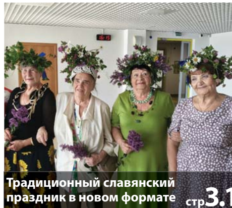
Традиционный славянский праздник в новом формате стр.3.1

ТВ ПРОГРАММА НА НЕДЕЛЮ 14.07 - 20.07 СТР. > 7-8 | 9-10