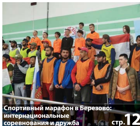
Спортивный марафон в Березово: интернациональные соревнования и дружба стр. 12

ТВ ПРОГРАММА НА НЕДЕЛЮ 23.06 - 29.06 СТР. > 7-8 | 9-10