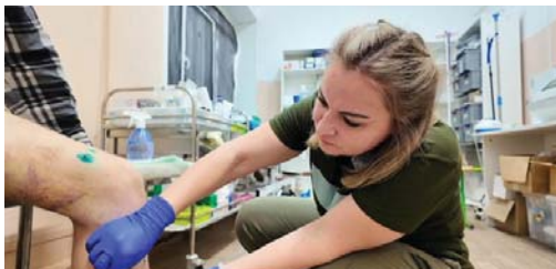
Галина до заключения контракта участвовала в волонтерской организации «Сбор ХМ»

За самоотверженность и спасение жизней она награждена медалью «За спасение погибавших» – одной из самых высоких наград для военного медика.