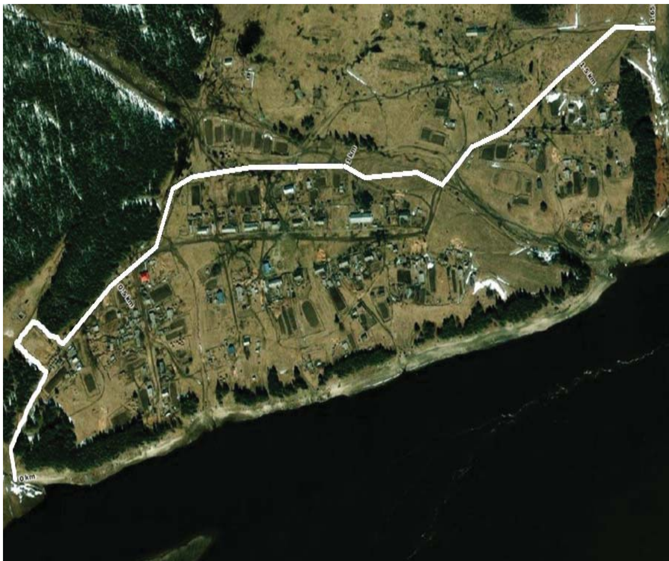
Схема грунтовой дороги д. Шайтанка

Приложение 2 к распоряжению администрации Березовского района от _____ 2025 года № _____