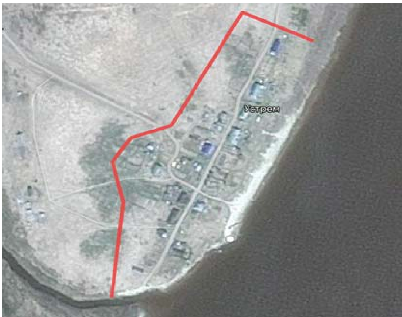
Схема минерализованной полосы п. Устрем

Приложение 2 к распоряжению администрации Березовского района от _____ 2025 года № _____