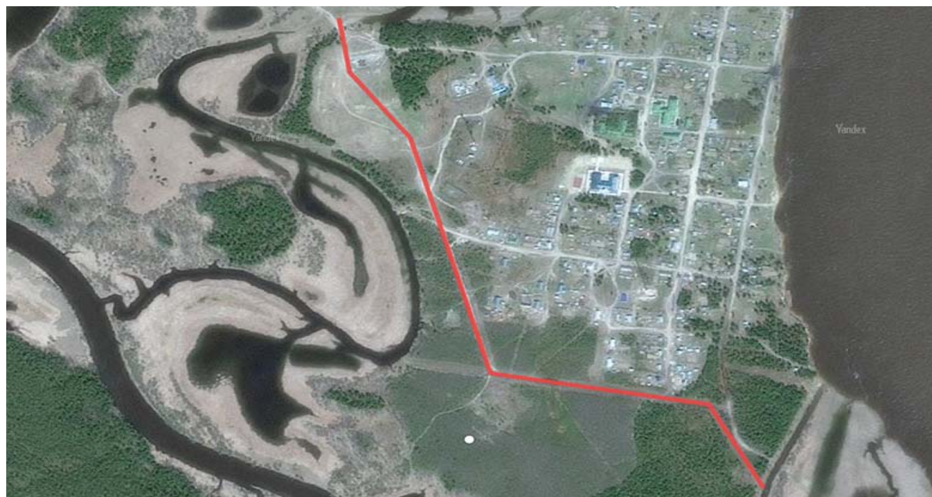
Схема грунтовой дороги с Теги

Приложение 2 к распоряжению администрации Березовского района от _____ 2025 года № _____