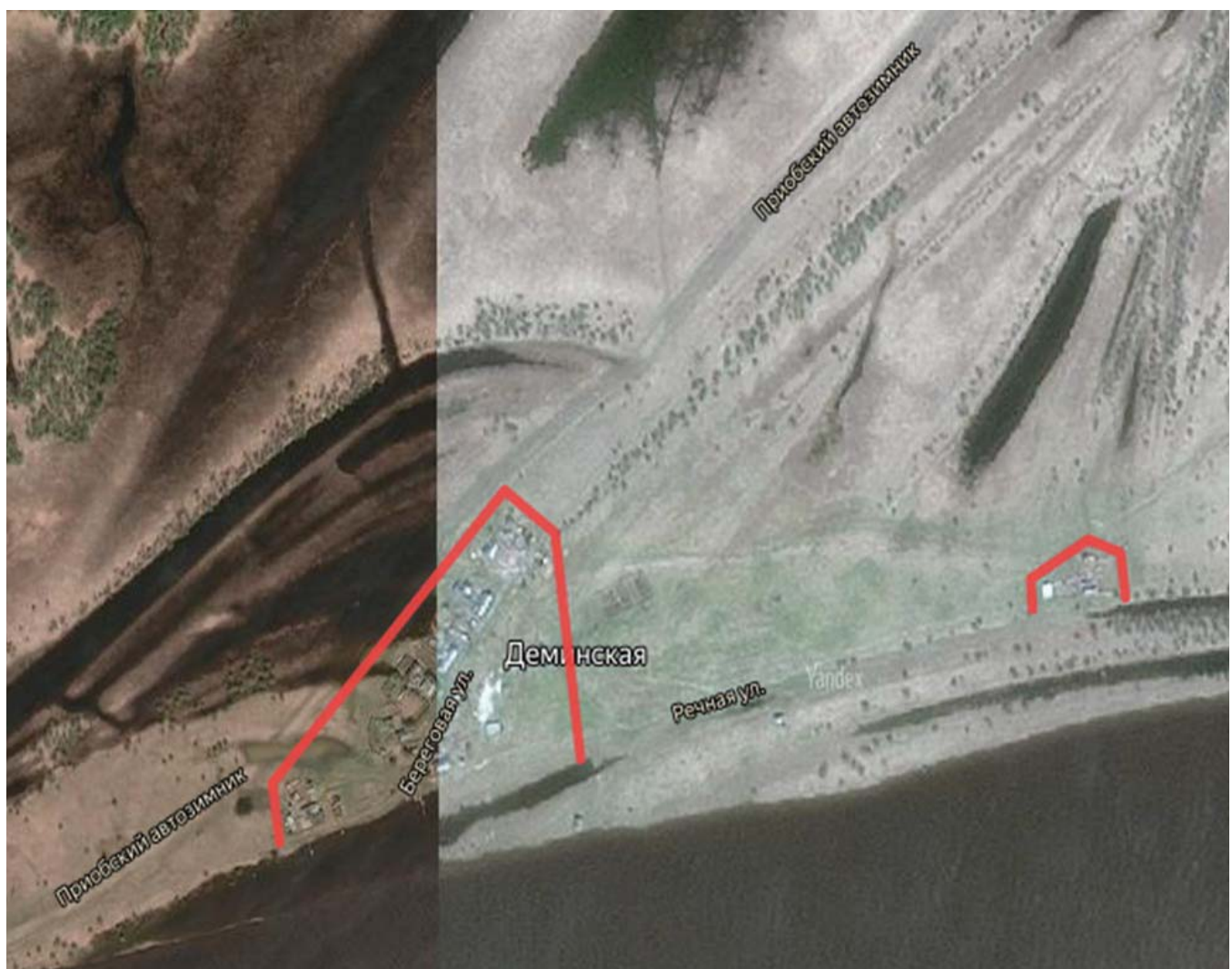
Схема минерализованной полосы д. Деминская