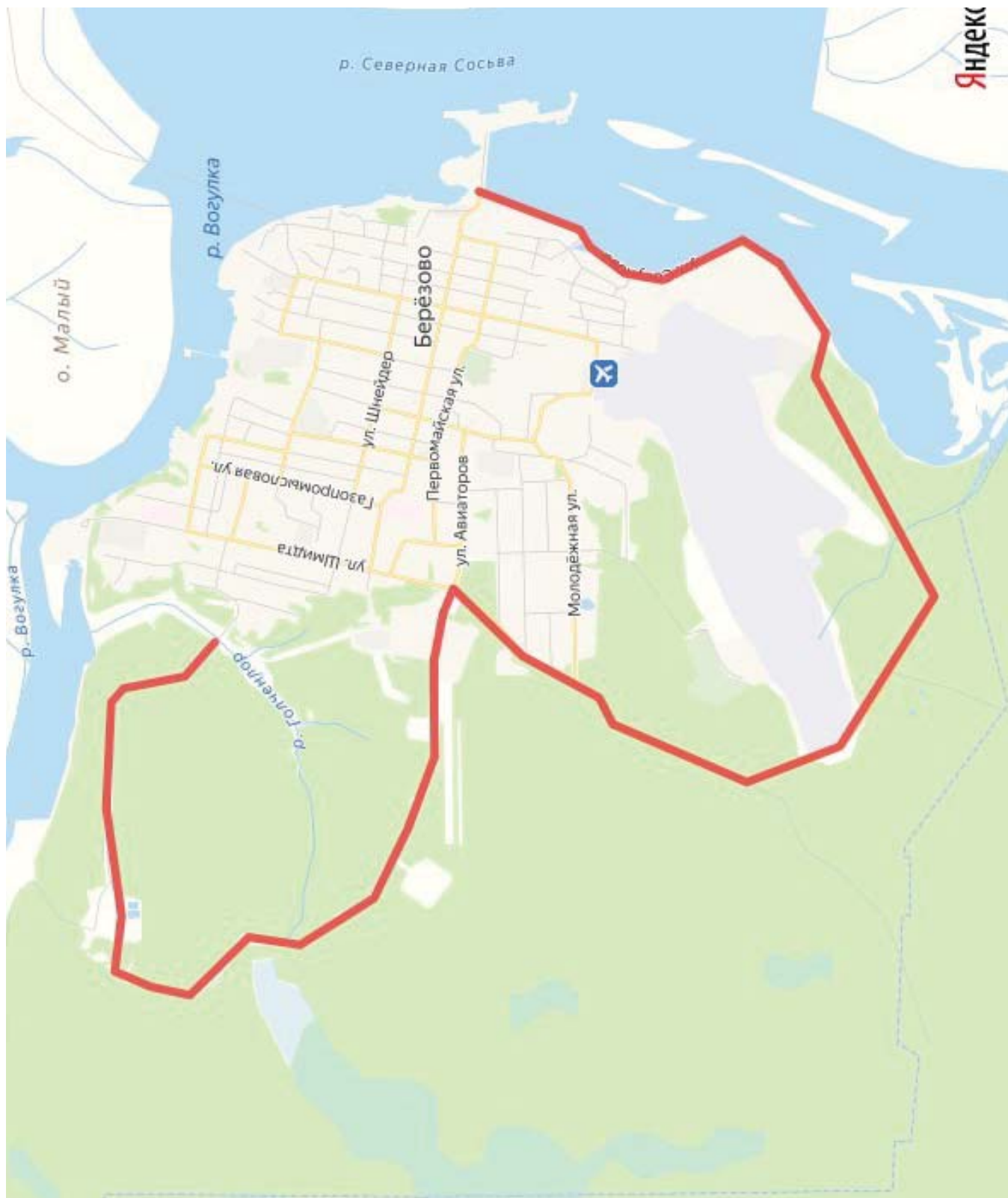
Схема дороги с асфальтовым покрытием пгт. Березово

Приложение 2 к распоряжению администрации Березовского района от _____ 2025 года № _____