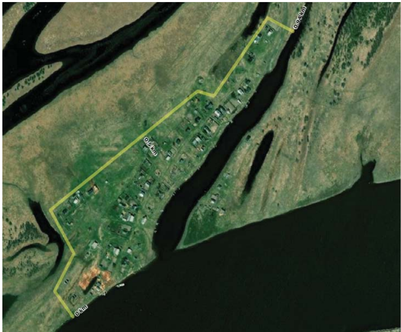
Схема минерализованной полосы д. Пугоры

Приложение 2 к распоряжению администрации Березовского района от _____ 2025 года № _____