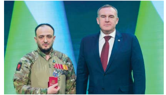
Знак «Герой Югры» вручается за героические и социально значимые поступки, получившие общественное признание в округе и за его пределами

Свой первый орден Мужества Геворк Санашоков получил за то, что принял командование на себя, когда комбат получил ранение. Капитан убежден, что лич-