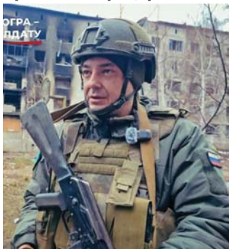
Трудолюбие, целеустремленность, смелость и верность долгу – качества, которые сделали из гражданского инженера настоящего боевого офицера

– Почему сюда пришел? Увидел беспредел, который творят нацисты, которые не считают себя нацистами, но детей и мир-