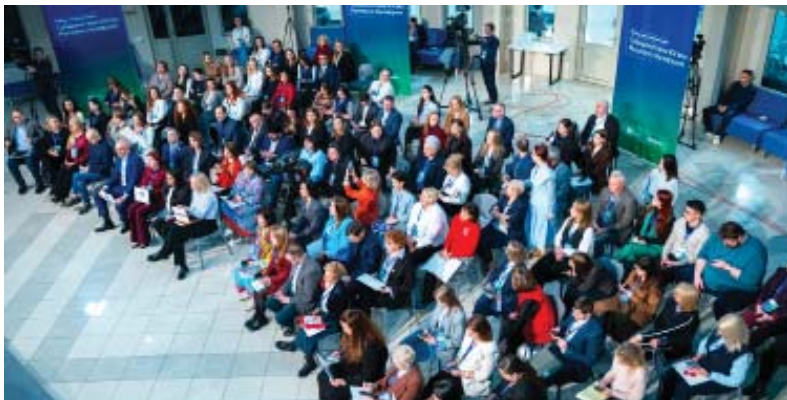
На разговор с губернатором аккредитовались 130 представителей федеральных и региональных СМИ, блогосферы и пресс-служб различных организаций