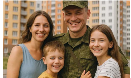
Югра безусловный лидер по финансовой поддержке при заключении контракта на воинскую службу

«Также все участники СВО имеют право приостановить исполнительные производства. Однако приостановить – не означает прекратить! Кроме того, такая мера не распространяется на требования по алиментным обязательствам, а также по обязательствам о возмещении вреда жизни или здоровью граждан (в том числе по обязательствам о возмещении вреда в связи со смертью кормильца), а также на требования имущественного характера, возникшие в результате совершения кор-