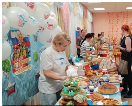
Добро и патриотизм стр.4.2

ТВ ПРОГРАММА НА НЕДЕЛЮ 17.11 - 23.11 СТР. > 7-8 | 9-10