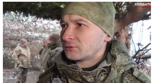
Родные стены и письма близких для «Рус» – не слова, а реальная поддержка, которую ценят все в подразделении

Он очень ждал встречи с родными, осознав всем сердцем, что семья – это самое ценное, что у него есть.